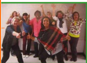
L'équipe de Ste-Jeanne-d'Arc